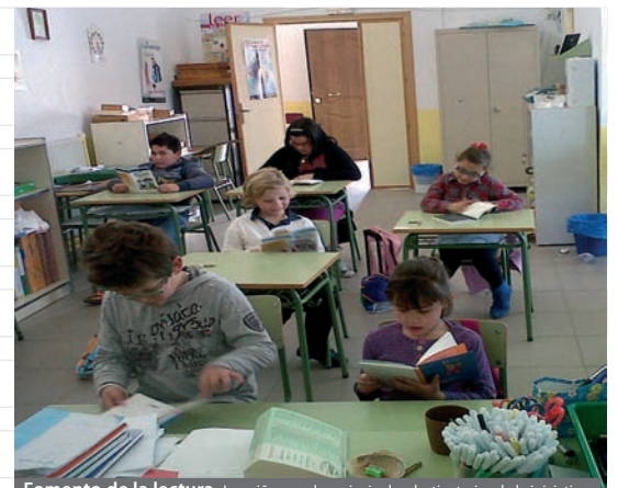
Fomento de la lectura. Los niños son los principales destinatarios de la iniciativa.

Sin embargo, también es necesario que los familiares de los alumnos se impliquen en esta tarea de forma activa y motiven a los pequeños en la iniciación a la lectura.