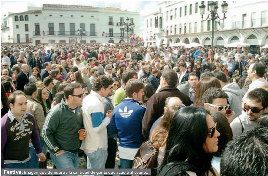
Festiva. Imagen que demuestra la cantidad de gente que acudió al evento.

TRADICIÓN La cita tuvo lugar en la plaza de España y anexa a ella se celebró la XV Feria del Embutido