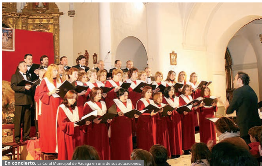
En concierto. La Coral Municipal de Azuaga en una de sus actuaciones.

Uno de los objetivos de la agrupación, según declaraciones de sus responsables, es devolver al pueblo todo lo que esta localidad