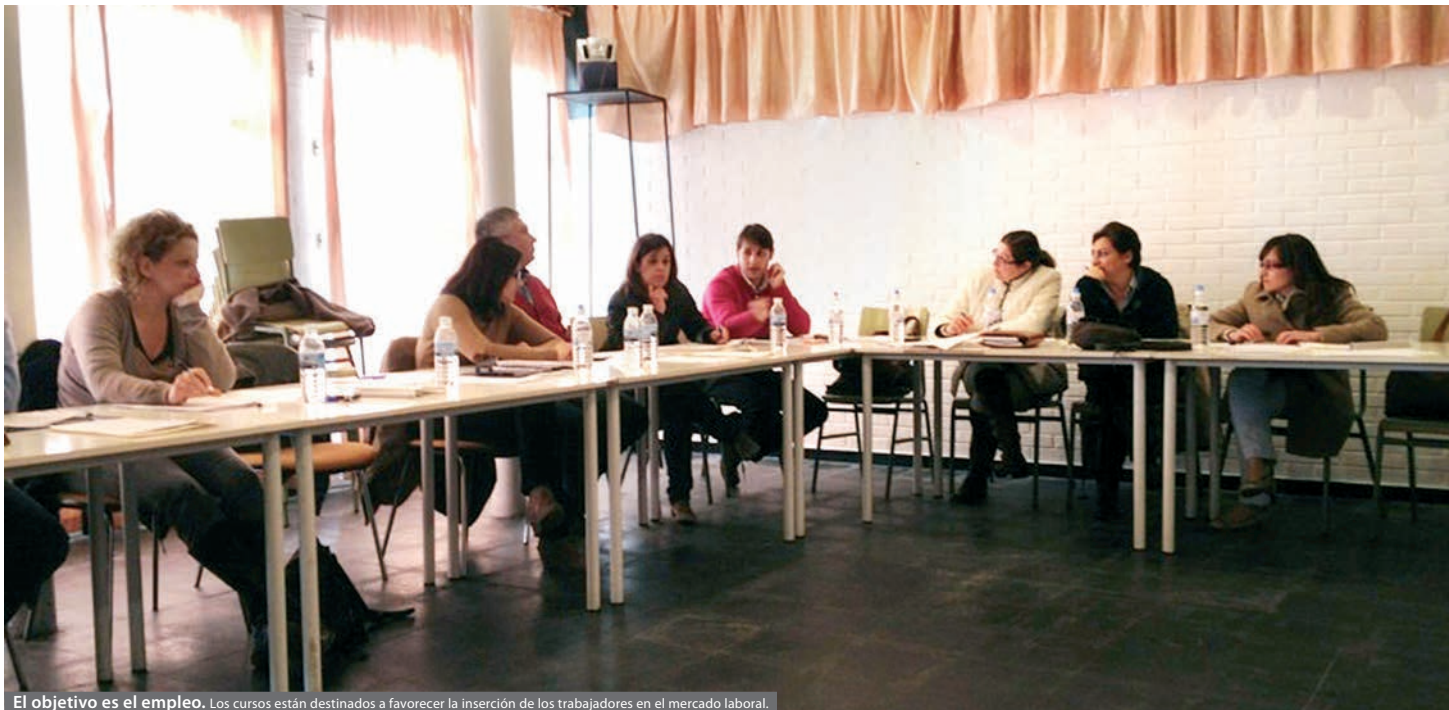
El objetivo es el empleo. Los cursos están destinados a favorecer la inserción de los trabajadores en el mercado laboral.

INMEDIATEZ La intención es que la puesta en marcha de las acciones formativas tenga lugar en el menor tiempo posible