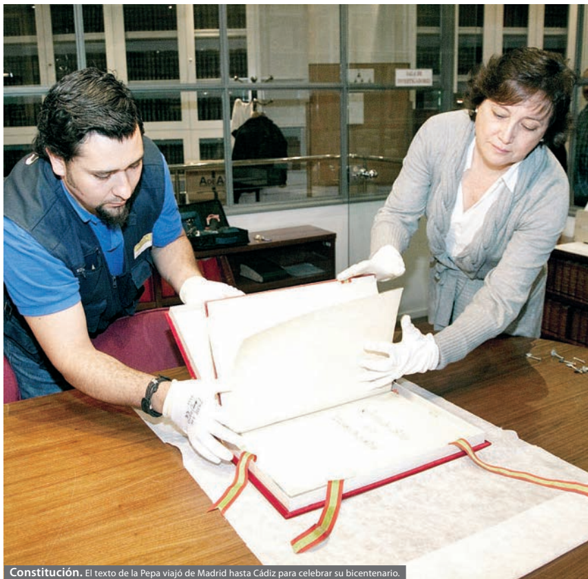
Constitución. El texto de la Pepa viajó de Madrid hasta Cádiz para celebrar su bicentenario.