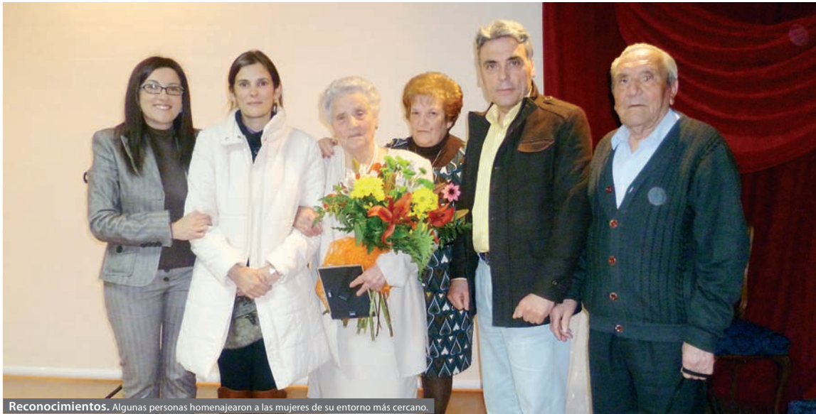
Reconocimientos. Algunas personas homenajearon a las mujeres de su entorno más cercano.

GRANJA DE TORREHERMOSA El fin de fiesta lo puso la música de Alberto Arroyo acompañado de los bailarines de Al Compás