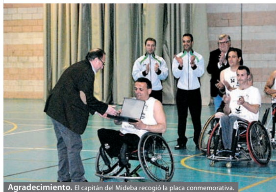
Agradecimiento. El capitán del Mideba recogió la placa conmemorativa.

Este tipo de iniciativas, como la Feria de la Tapa Mudéjar, sirven para dinamizar la economía local y para que los vecinos de Llerena puedan disfrutar de una oferta de ocio diferente a la que habitualmente hay en la localidad. Asimismo los hosteleros locales tratan de mejorar su carta para hacerse con el premio y para ofrecer un mejor servicio a los clientes.