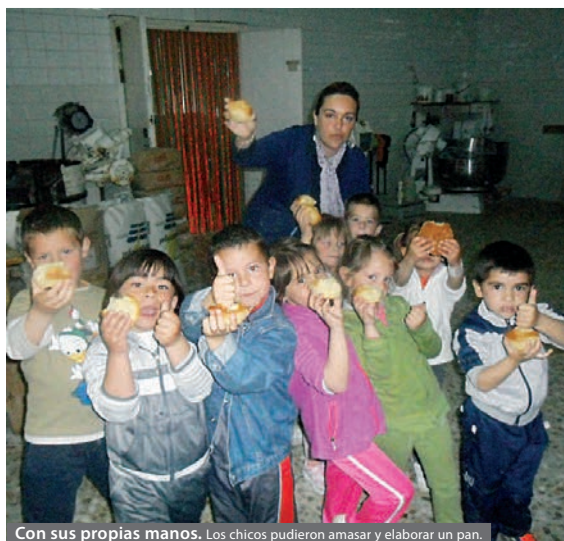
Con sus propias manos. Los chicos pudieron amasar y elaborar un pan.

Con estas sesiones lectivas fuera de las aulas, los alumnos aprenden también la importancia de los trabajos artesanales y el esfuerzo que realizan los profesionales que se dedican a estas labores, que se siguen efectuando en el entorno de la Campiña Sur. De este modo, los chicos valorarán más unos trabajos, en muchas ocasiones, poco reconocidos.