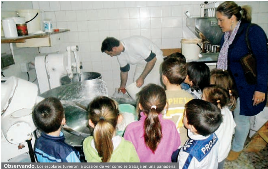
Observando. Los escolares tuvieron la ocasión de ver como se trabaja en una panadería.

HIGUERA DE LLERENA Los estudiantes aprendieron la importancia de los trabajos artesanales