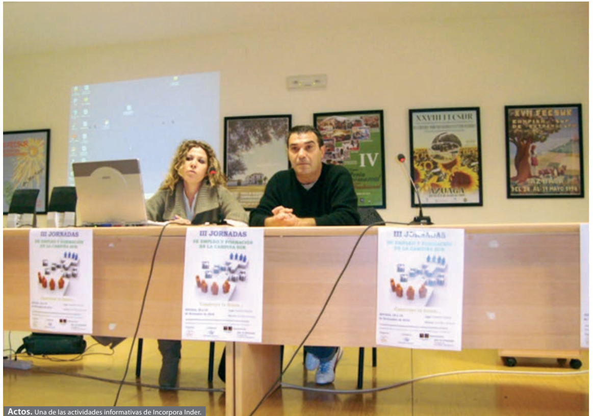
Actos. Una de las actividades informativas de Incorpora Inder.

En esta línea de participación comunitaria y colaboración entre los diferentes recursos sociales, el equipo técnico 'Incorpora Inder Llerena', ha aportado su experiencia, como lleva haciendo desde años anteriores, mediante diferentes Jornadas de Empleo, Formación y Ocio de la Campiña Sur. La próxima celebración de dicha sesión se realizará en la localidad de Azuaga, donde participarán los técnicos del 'Proyecto Incorpora Inder' impartiendo una ponencia para todos los asistentes. Esta visita se llevará a