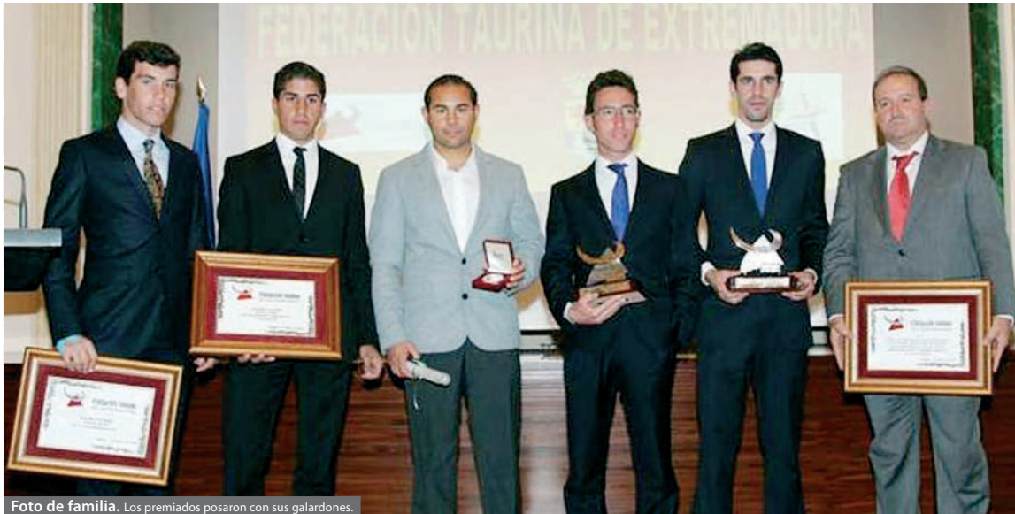
Foto de familia. Los premiados posaron con sus galardones.