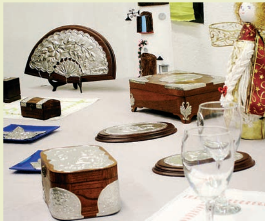
Exposición. La muestra estuvo dedicada al dedal.