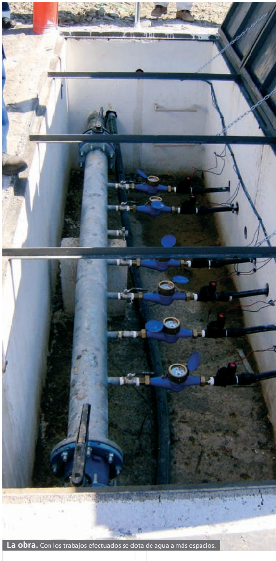
La obra. Con los trabajos efectuados se dota de agua a más espacios.

Las obras se prolongaron durante nueve meses y las realizó la empresa constructora OSEPSA.