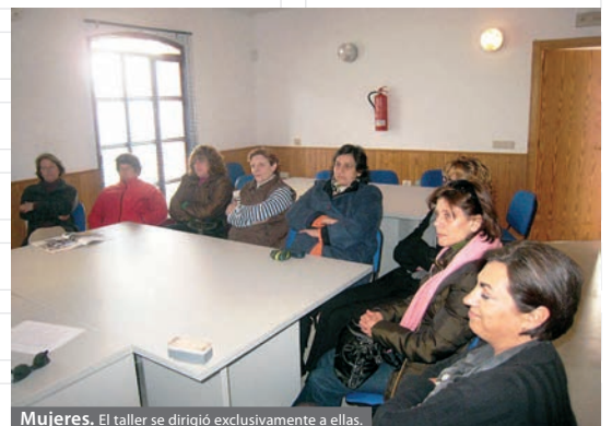
Mujeres. El taller se dirigió exclusivamente a ellas.

Al término de la jornada, y como forma de poner en práctica lo allí expuesto, se propuso a las participantes elaborar un proyecto realista a partir de un supuesto práctico y detectar en su propia localidad cuestiones que serían susceptibles de mejorarse con un plan de emprendimiento adecuadamente diseñado.