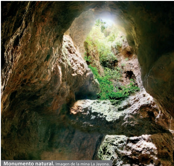
Monumento natural. Imagen de la mina La Jayona.