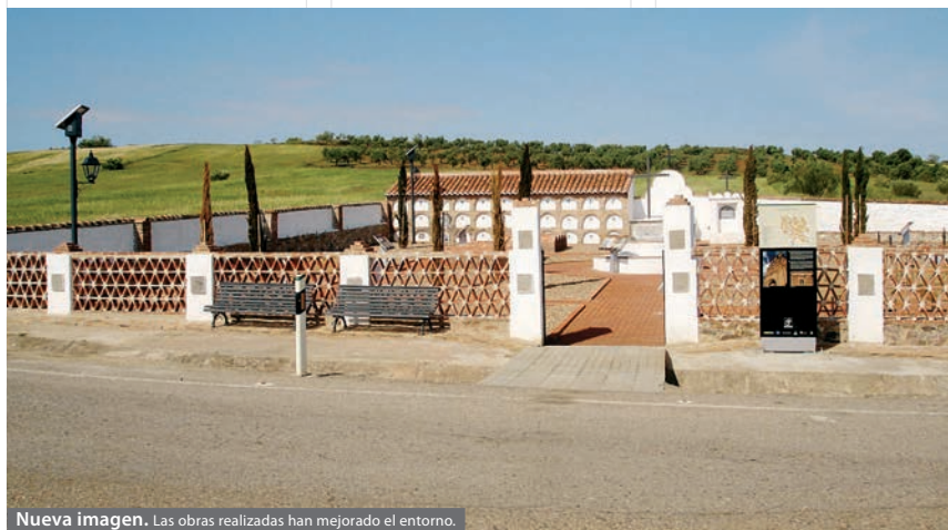
Nueva imagen. Las obras realizadas han mejorado el entorno.

Campillo queda abierto a todo tipo de visitantes interesados en esta franja de la historia tan dolorosa y al mismo tiempo tan atractiva.