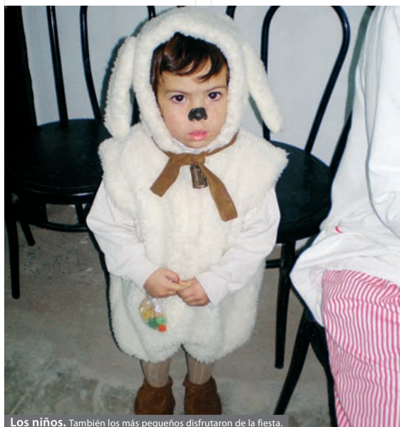
Los niños. También los más pequeños disfrutaron de la fiesta.