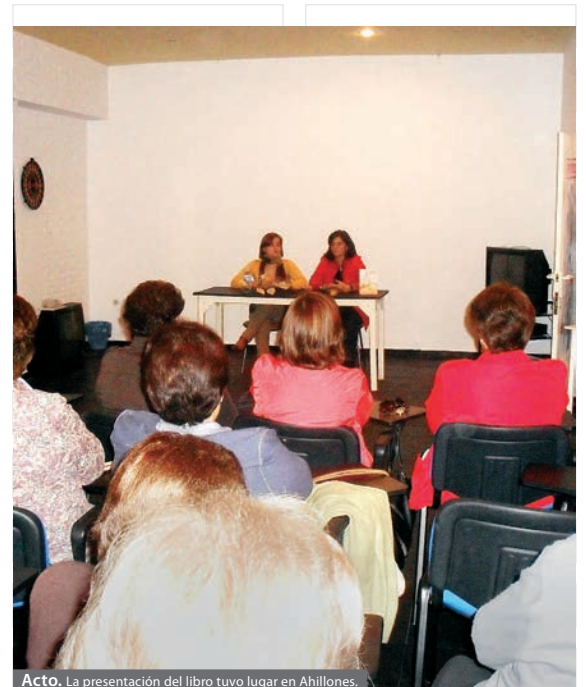
Acto. La presentación del libro tuvo lugar en Ahillones.