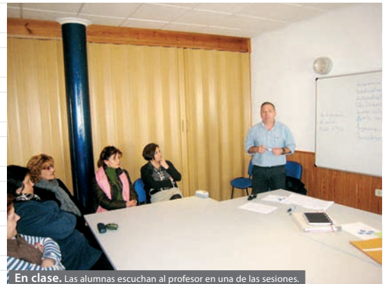
En clase. Las alumnas escuchan al profesor en una de las sesiones.

REDACCIÓN. Las mujeres fueron las protagonistas del taller que se celebró en Peraleda del Zaucejo.