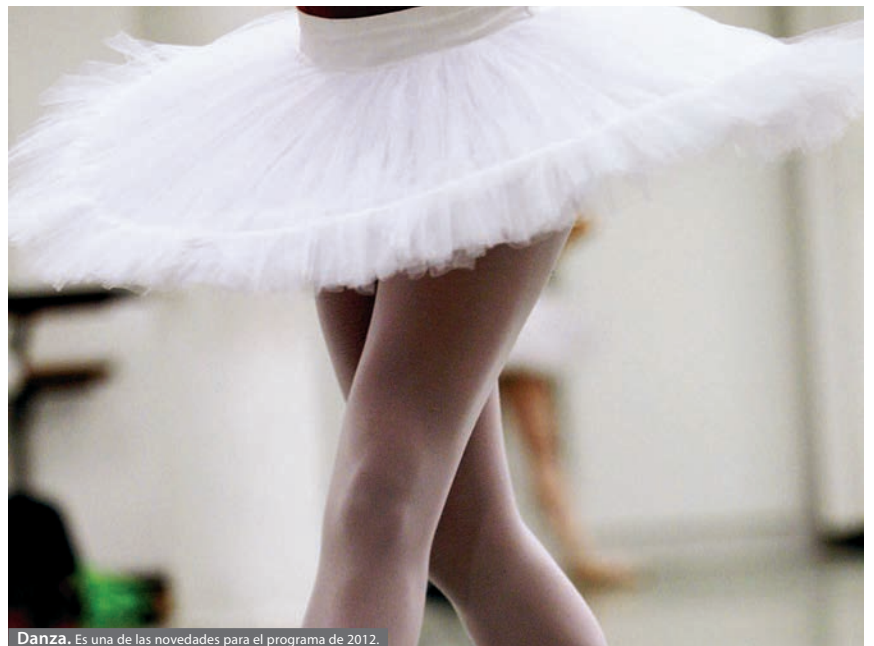
Danza. Es una de las novedades para el programa de 2012.

El objetivo del proyecto es el aprendizaje de una obra audiovisual y la formación de espectadores críticos. «Sirven también -concluye Ruíz- para que los participantes tomen contacto con aspectos que desconocían de sus propios municipios».