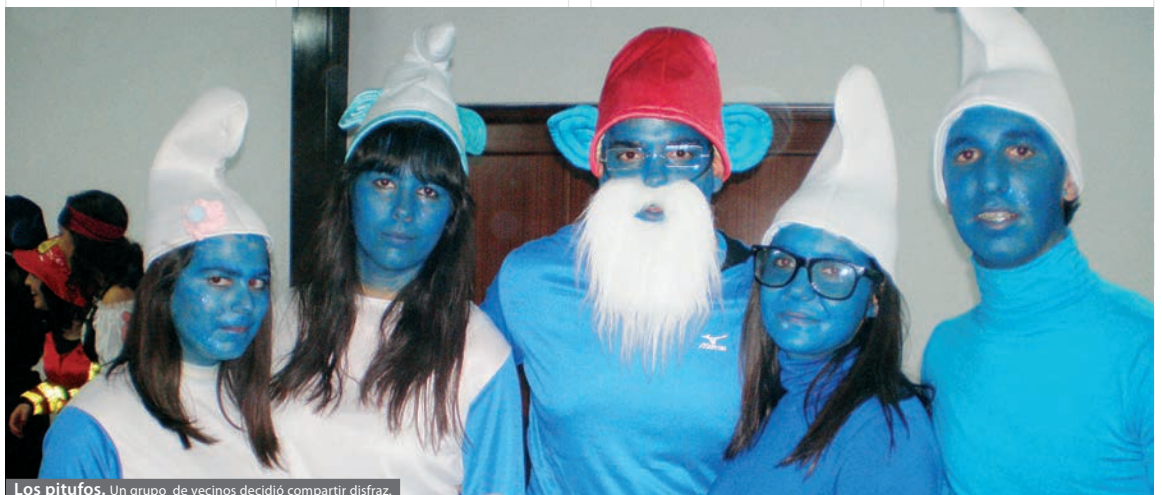
Los pitufos. Un grupo de vecinos decidió compartir disfraces.

Con el entierro de la sardinada se pone fin a las fiestas de Don Carnal y en Trasierra se celebra la jornada con una sardinada popular para todos los vecinos.