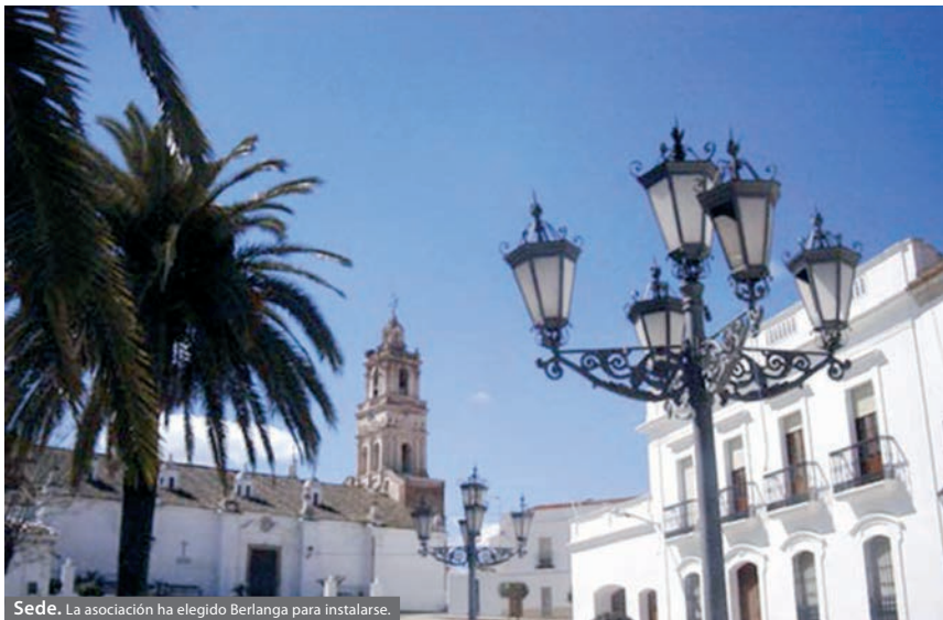
Sede. La asociación ha elegido Berlanga para instalarse.

J.M.M. Se ha puesto en marcha la Asociación Juvenil Campisur en Berlanga.