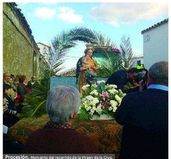
Procesión. Momento del recorrido de la Virgen de la Cruz.