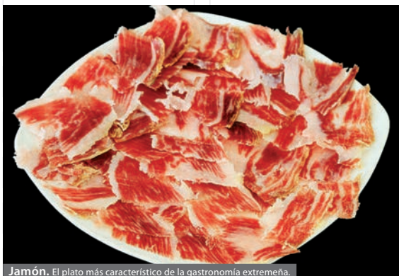
Jamón. El plato más característico de la gastronomía extremeña.

Aún no se conoce el nombre de la mejor tapa, ni el del ganador del lote de productos con los que obsequia Berlanga para la ocasión. Se espera que tras la experiencia de esta I Ruta de la Tapa sean muchas más sucesivas y la cita se haga imprescindible. En la localidad se confía en que el evento anime a convocar al mayor número de participantes posibles para otros años, ya que aseguran que no hay que perder las buenas costumbres españolas con el mejor sabor extremeño.