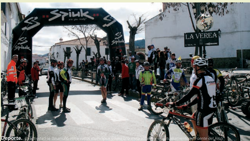
Deporte. La actividad se desarrolló entre varios municipios y tuvo una meta volante, el ayuntamiento en Fuente del Arco.