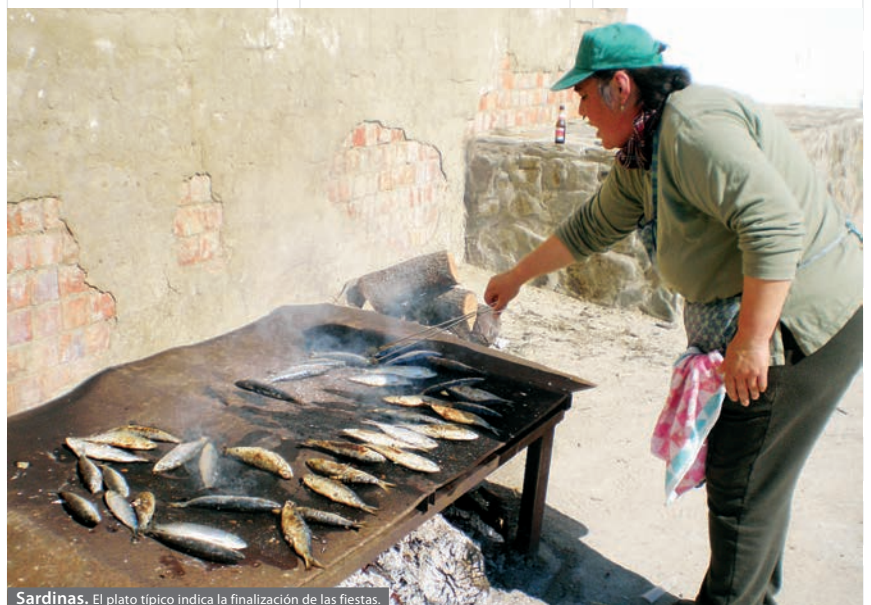
Sardinadas. El plato típico indica la finalización de las fiestas.