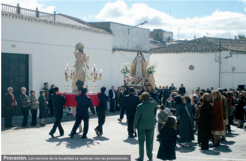
Procesión. Los vecinos de la localidad se vuelcan con las procesiones.

DE FIESTA Los días festivos y la semana de vacaciones escolares crean un gran ambiente en la localidad