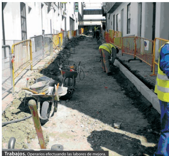
Trabajos. Operarios efectuando las labores de mejora.

Las obras de adecuación del tramo de la calle Santana hasta la esquina con la calle Sol ya han comenzado. También se arreglarán los acerados hasta el cruce con la vía Prieto Molina. Los trabajos consistirán en la ejecución de red de saneamiento y red de pluviales, la sustitución de acometidas domiciliarias de red de abastecimiento y la sustitución de acerados y pavimentación en plataforma única. Además se ha concluido la instalación del ascensor del Museo Etnográfico. Esta obra se ha realizado dentro del Plan de Accesibilidad y ya funciona. Desde hace unos días está a disposición para todos aquellos usuarios que lo necesitan para poder acceder a las dependencias del Museo.