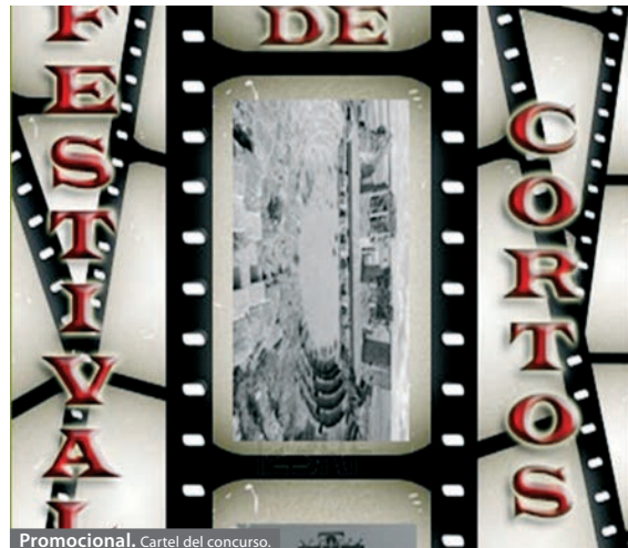
Promocional. Cartel del concurso.