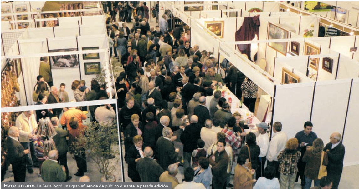
Hace un año. La Feria logró una gran afluencia de público durante la pasada edición.

En la coyuntura económica actual, marcada por la crisis, FECSUR se convierte en una oportunidad única para acercar los productos al productor y al consumidor, al proveedor y al cliente. En definitiva, se trata de mostrar la economía de la comarca y contribuir a la apertura de nuevos mercados y a la mejora social y económica de la misma. Por lo que, desde la Institución Ferial se trabaja en la presencia de las empresas más representativas de la Campiña Sur y que la Feria constituya un éxito para ellas.