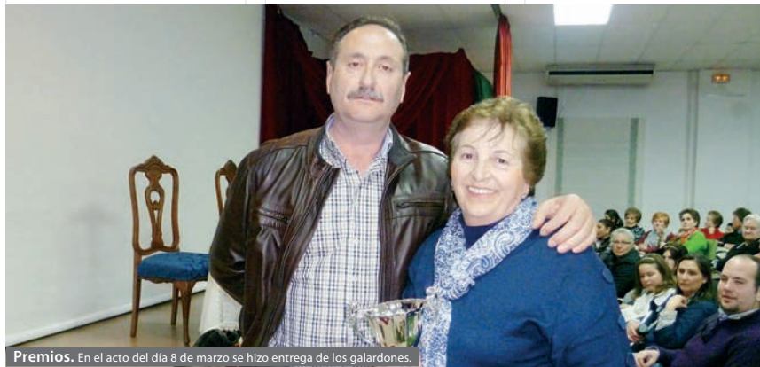
Premios. En el acto del día 8 de marzo se hizo entrega de los galardones.

REDACCIÓN. El Día Internacional de la Mujer, que se celebra el 8 de marzo, conmemora la lucha de las mujeres por su participación, en pie de igualdad con el hombre, en la sociedad y en su desarrollo íntegro como persona.