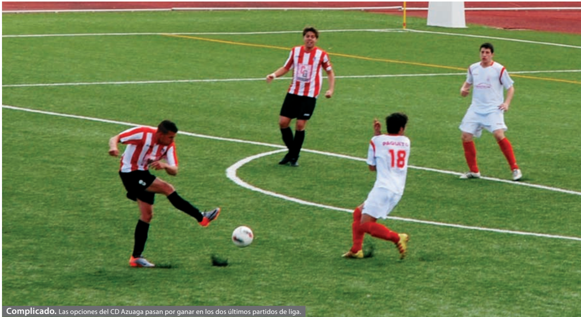
Complicado. Las opciones del CD Azuaga pasan por ganar en los dos últimos partidos de liga.

DOS PARTIDOS A falta de dos jornadas para el final el equipo se encuentra en quinta posición