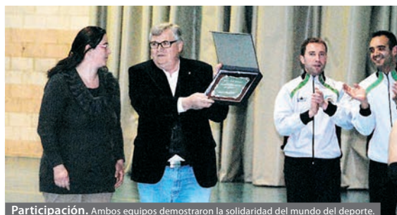
Participación. Ambos equipos demostraron la solidaridad del mundo del deporte.