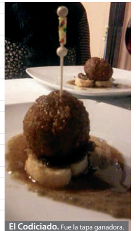
El Codiciado. Fue la tapa ganadora.