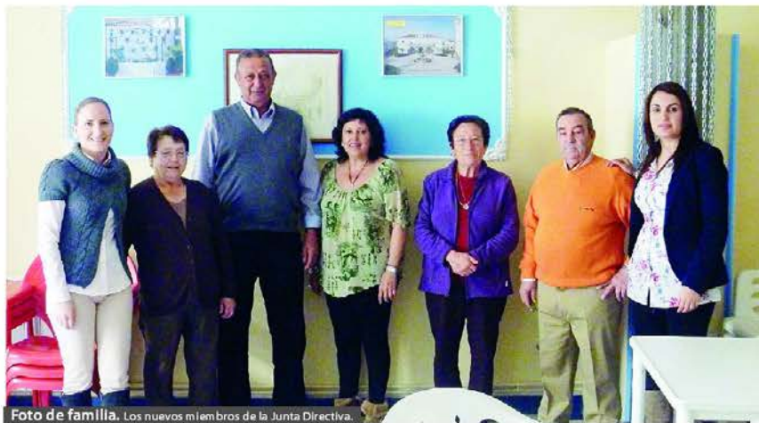
Foto de familia. Los nuevos miembros de la Junta Directiva.

Desde el Ayuntamiento se pondrán a disposición del Club San Pedro todos los recursos disponibles, tal y como se ha estado haciendo hasta ahora, tratando de facilitarles la labor tan importante que llevan a término.