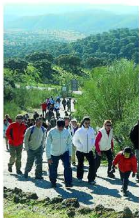
En marcha. Edición anterior.

La cita estará organizada por el colegio público Miramontes y contará con la colaboración de la Asociación de Madres y Padres del mismo centro, la Asociación Folklórica 'El Sondilindón' y el ayuntamiento de Azuaga. A las 18.30 horas habrá un desfile de niños, ataviados con el traje regional, portando la bandera extremeña y acompañados de la Banda de Cornetas y Tambores 'Cristo del Humilladero'. La salida se situará en el colegio Miramontes y recorrerán las calles de la localidad. En la Plaza del Cristo se realizará una ofrenda floral en la Iglesia. La jornada concluirá con varios concursos deportivos.